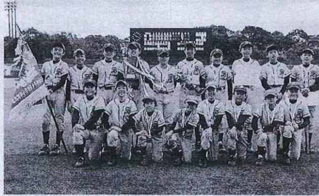
優勝の谷津小学校区

第32回モリシア杯習志野 会が10月28日から11月11日 市小学校区対抗少年野球大会まで、秋津野球場ほかで開かれた。大会は雨天のため順延と